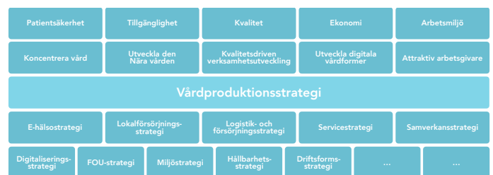
Strategiska perspektiv – Vårdproduktionsmatris